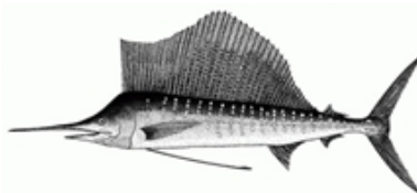
Tableau 1. État du stock de voilier indopacifique ( Istiophorus platypterus ) dans l'Océan Indien.